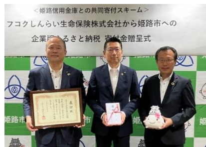
写真は姫路市への寄付金贈呈式の写真を使用

この度、2024 年度の取組み分として、神戸市および姫路市に企業版ふるさと納税制度を活用して寄付金を贈呈いたしました。