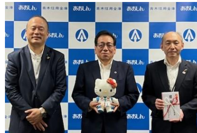
HELLO KITTY © '25 SANRIO CO., LTD. APPR. NO. L660295

この度、2023 年度から 2024 年度の取組み分として、社会福祉法人 川口市社会福祉協議会（以下、「川口市社会福祉協議会」）に寄付金を贈呈いたしました。