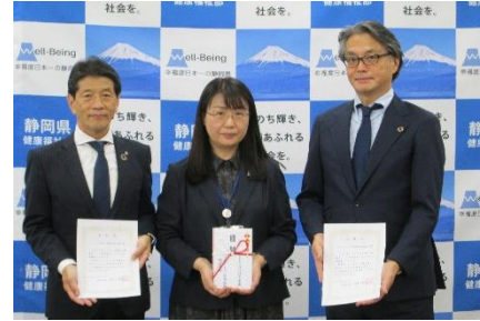
贈呈式後に記念撮影する関係者

この度、2025 年度の取組み分として、こどもの居場所応援基金事業に寄付金を贈呈いたしました。